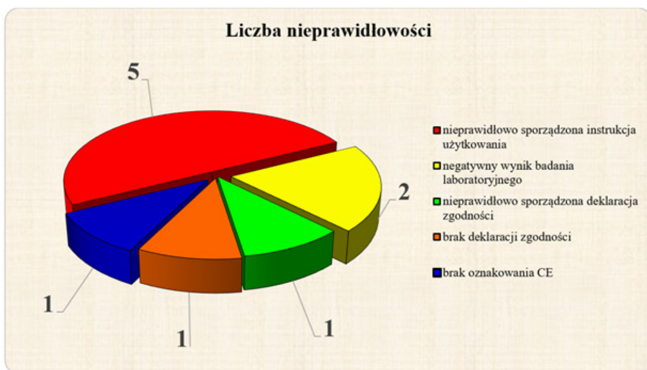
Wykres Nr 2: Liczba nieprawidłowości stwierdzonych podczas kontroli.

Od tej decyzji wniesiono odwołanie do Prezesa UOKiK jako organu II instancji. W chwili obecnej toczy się postępowanie odwoławcze. Natomiast w przypadku drugiej półmasksi, zakwestionowanej podczas badań laboratoryjnych Inspekcja Handlowa, po zakończeniu czynności kontrolnych, przekazała akta ww. sprawy do Urzędu Ochrony Konkurencji i Konsumentów. Prezes UOKiK wszczął postępowanie administracyjne w tej sprawie.